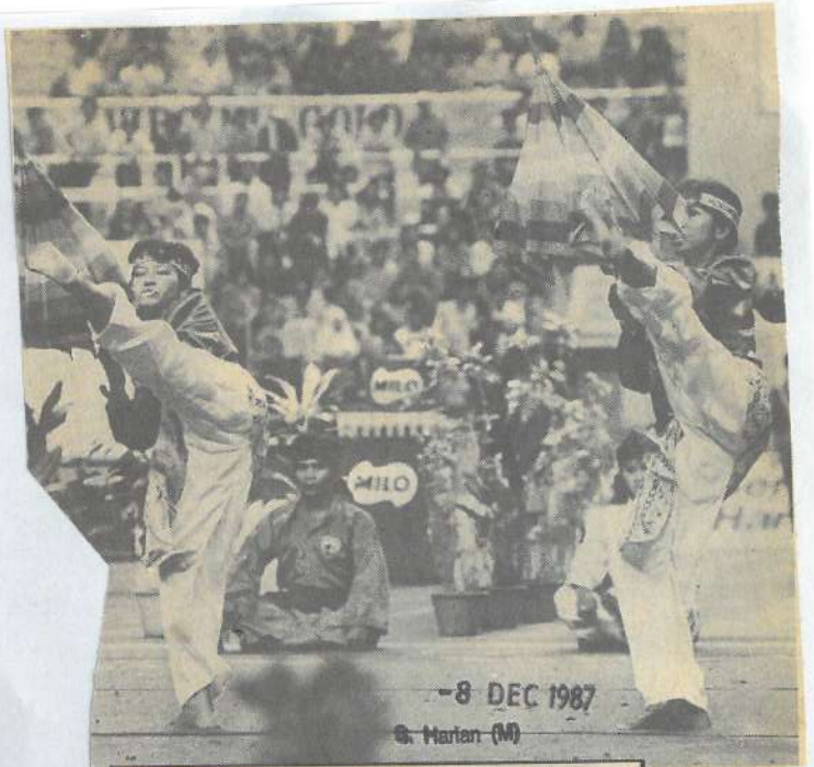
MSILAT PAYUNG... Dua pesilat wanita mengayakan buah-buah silat dengan menggunakan payong.